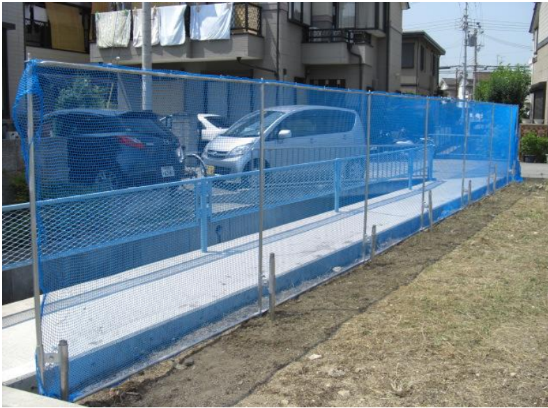
ブルーネット仕様 網目15mm *注