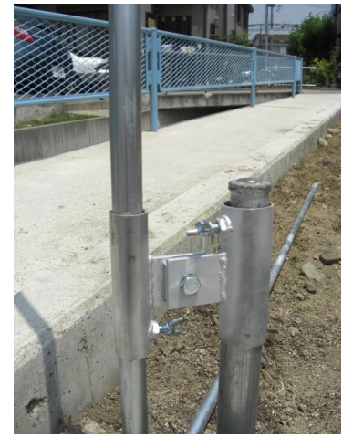
支柱たちが調節可能