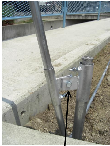
首振り式杭ガイドなので