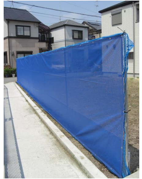
メッシュシート仕様 *注